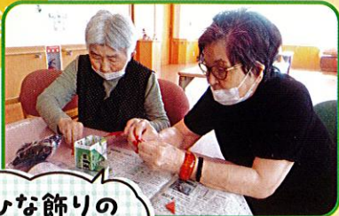
ひな飾りの 作成中♪

春の訪れを告げる行事として、各部署でひなまつりを行いました。 皆様がこれからも健康で幸せな生活を送れるようにと、願いを込められた温かい行事となりました。