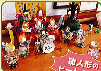
雛人形の ビートルズ!!