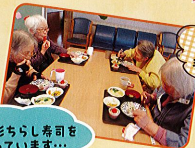
皆で 作ったから 美味しいわ!