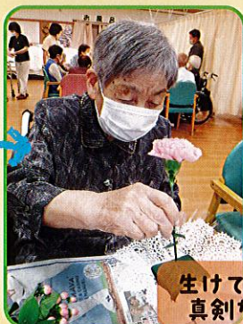
生きていきます 真剣な表情!