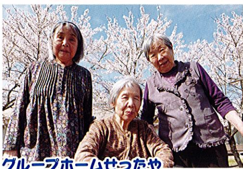
グループホームせつたや

満開の時期は、岡南の郷の園庭の桜をそれぞれ楽しみました。 とってもきれいだね～！