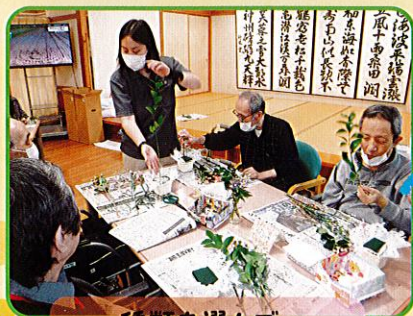
種類を選んで… どのお花が好きですか?

フラワーアレンジメントにチャレンジしていただきました。普段お花に触れる機会が少ない方ほど 真剣にチャレンジしていただき、ステキな作品がたくさんできあがりました♡