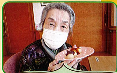
おやつにみたらしと あんこのお団子を作りました♡