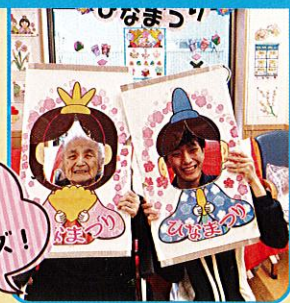
職員と 一緒に はい!チーズ!