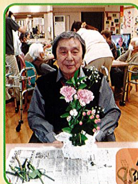
ハイ!完成! 似合うかな?