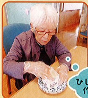
ひし形ちらし寿司を 作っています…