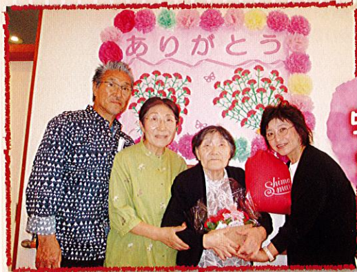
豪華なお弁当でお祝いしました