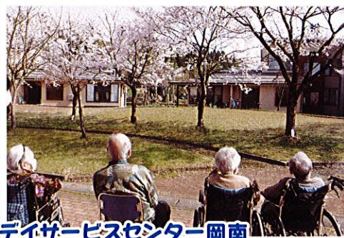
デイサービスセンター岡南